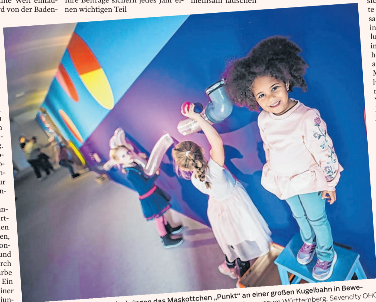
Landesmuseum BUNT: Kinder bringen das Maskottchen „Punkt“ an einer großen Kugelbahn in Bewegung.

Alle Tickets und Infos unter junges-schloss.de , 0711 89 535 111, info@junges-schloss.de Buchung der Zeitfenster-Tickets online über https://www.landmuseum-stuttgart.de/museum/kindermuseum-junges-schloss