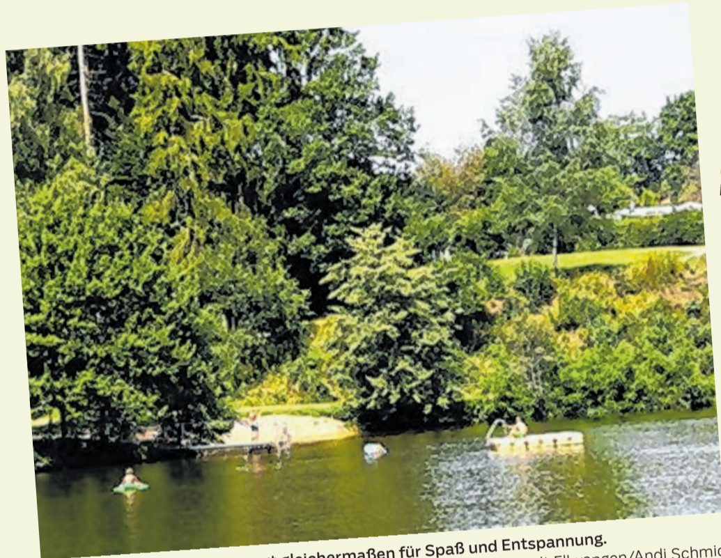
Ein Tag am Häslestausee sorgt gleichermaßen für Spaß und Entspannung.

Auf die Kultur folgt Natur: Mit lustigen Zwergziegen wandert die Familie vorbei an Äckern, Wiesen und Wald. Dabei geben die Ziegen das Tempo vor – denn auf das Ziehen am Strick reagieren sie