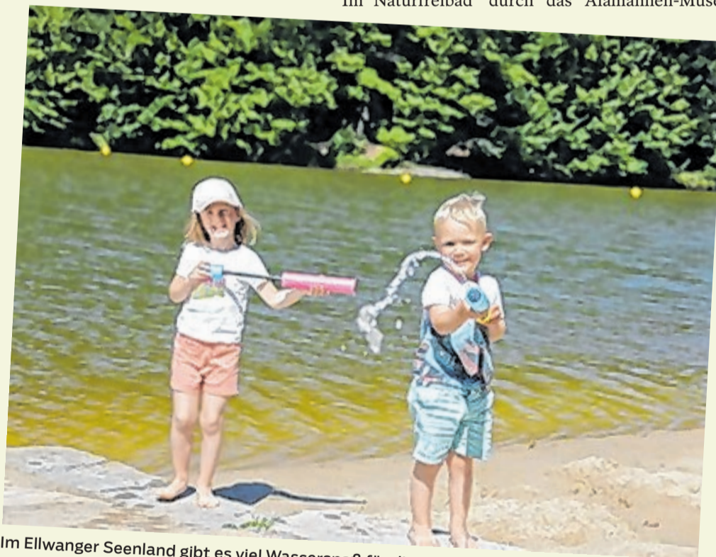
Im Ellwanger Seenland gibt es viel Wasserspaß für die Kleinen.