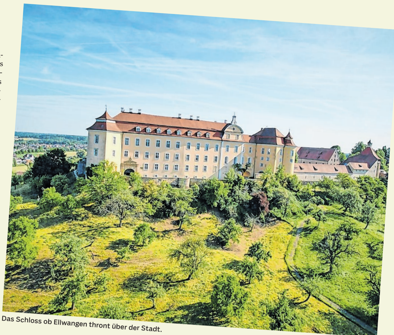
Das Schloss ob Ellwangen thront über der Stadt.