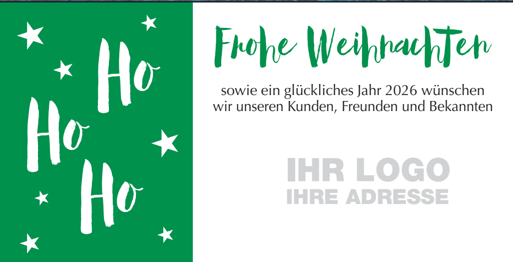
Muster 6: 3-spaltig 70 mm