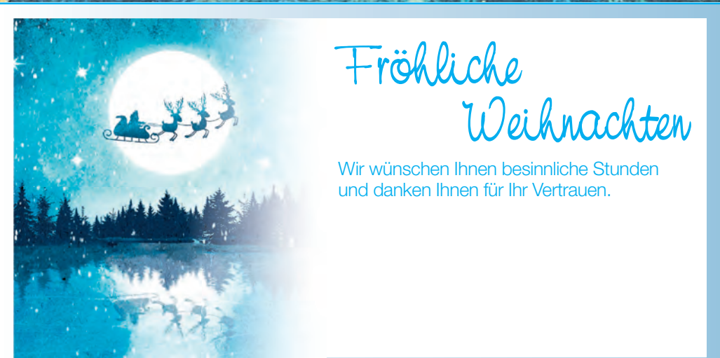
Muster 10: 3-spaltig 70 mm

Ihre Weihnachtsglückwünsche auf den Gewerbevereinsseiten erscheinen am 5./6. Dezember im TECK EXTRA.