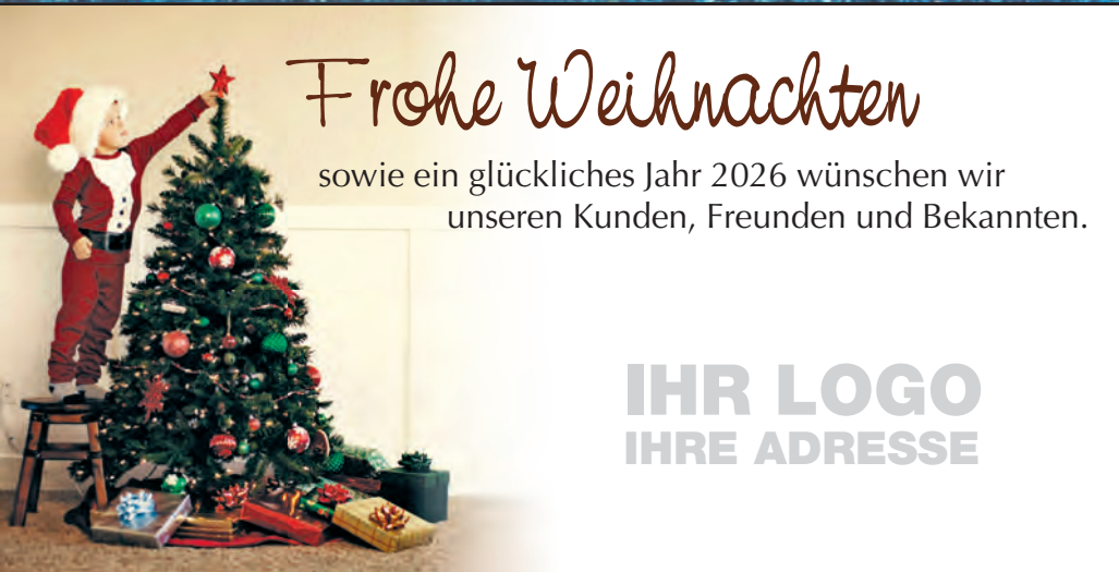
Muster 3: 3-spaltig 70 mm