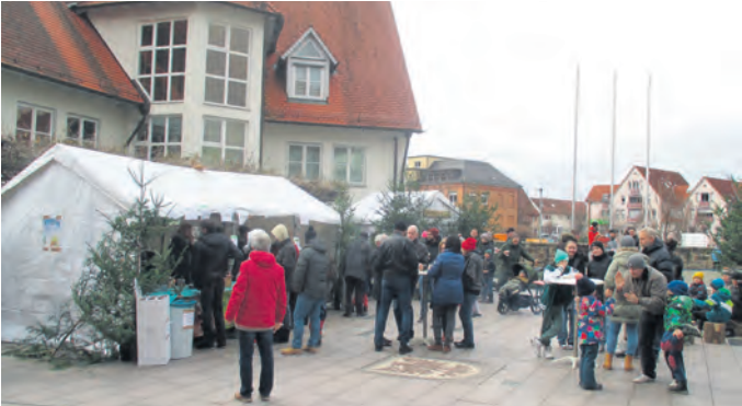
Waldkindergarten auf dem Bertoldsplatz.

verkaufen. Der Grundstein für die Weihnachtsmärkte war so gelegt und Jahr um Jahr verbreitete sich die Tra-dition der Weihnachtsmärkte weiter. Von Anfang an wur-de bei den Weihnachtsmärkten an das leibliche Wohl der Marktbesucher gedacht und so wurden neben Spielzeug und nützlichen Dingen auch geröstete Kastanien, Mandeln und Nüsse angeboten. Der Gewerbeverein Weilheim folgt dieser schönen Traditi-on bereits seit vielen Jahren und lädt alt und jung herz-lich zum traditionellen Ad-ventsmarkt rund um den