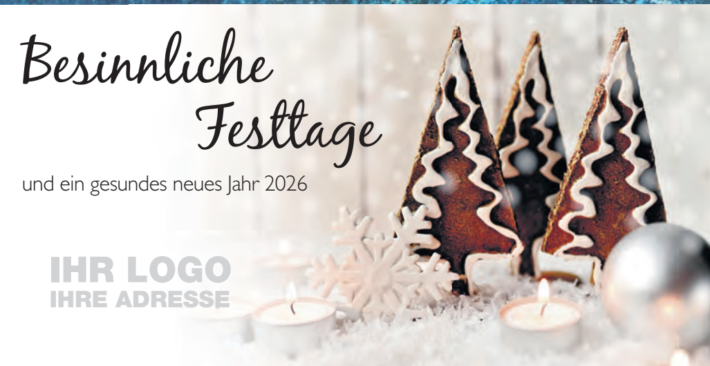
Muster 7: 3-spaltig 70 mm